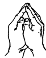
(佛龕手印) (Mudra Jinajik)

Pertama, bernamaskara kepada Mula Guru dan sepuluh penjuru Buddha dengan Mudra Jinajik.