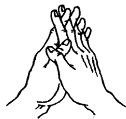
(三叉杵手印) (Mudra Trisula)

Bersujud kepada Para Vajra Dharmapala dan Dewa Naga.