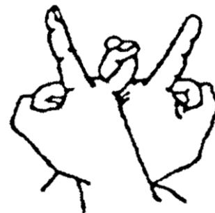
(蓮華生大士金剛手印) (Mudra Vajra Padmasambhava)

Kedua tangan saling bersilangan dan membelakangi, kedua jari kelinking saling mengait, kedua jari telunjuk menunjuk miring ke atas, kedua ibu jari menekan jari manis dan jari tengah yang membentuk lingkaran. (Letakkan di depan dada)