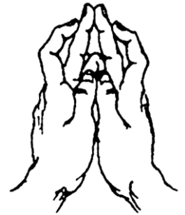
(準提佛母根本印) (Mudra Cundi Bhagawati)

小指及無名指左右內縛。豎立中指，左右食指各按中指之背。二大指相靠則成。（置胸前）