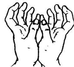
(蓮花手印) (Mudra Padma)