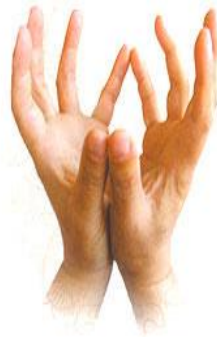
Mudra Shri Laksmi

keterangan Mudra : sama seperti mudra Avalokitesvara hanya tangannya tidak mekar seperti muda Avalokitesvara (agak kuncup)