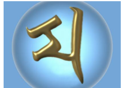
Aksara : Mo(摩)