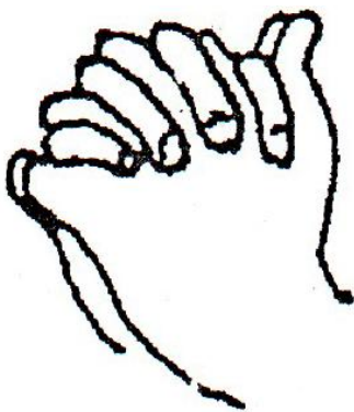
Mudra Jambala Merah