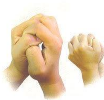
Mudra Amurwa Bhumi

南無三滿哆。 母馱南。 唵。 度嚕度嚕地尾。 梭哈。 nán mo sān mǎn duō. mǔ tuó nán. Om. dù lū dù lū de wěi. suō hā.