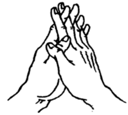
(三叉杵手印) (Mudra Trisula)

Bersujud kepada Para Vajra Dharmapala dan Dewa Naga.