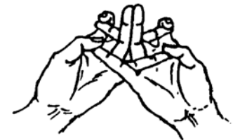
(供養手印) (Mudra Persembahan)

二無名指相背立，二中指伸直相叉。二小指伸直相叉，右食指勾左中指。左食指勾右中指，左大拇指按右小指。右大拇指按左小指，結印置胸前。觀想完後觸天心散印。