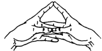
(平等手印) (Mudra Samaropa)

(有關「大禮拜」的觀想細節，請閱『密教大光華—細說真佛密法完整修持儀軌』第20頁。)