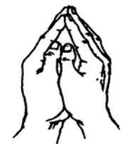
(佛龕手印) (Mudra Jinajik)

Pertama, bernamaskara kepada Mula Guru dan sepuluh penjuru Buddha dengan Mudra Jinajik.